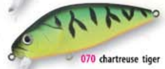
070 chartreuse tiger