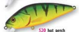
520 hot perch