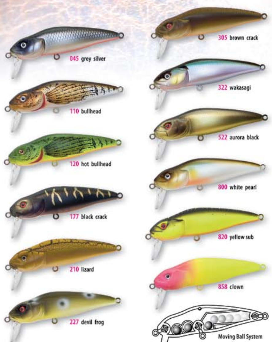
045 grey silver 305 brown crack 322 wakasagi 522 aurora black 800 white pearl 820 yellow sub 858 clown 110 bullhead 120 hot bullhead 177 black crack 210 lizard 227 devil frog