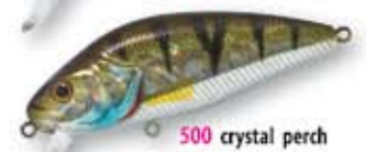
500 crystal perch