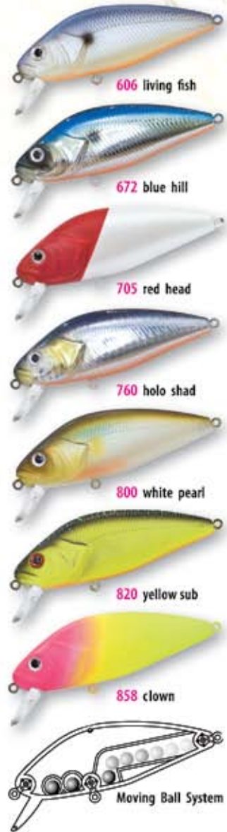
606 living fish 672 blue hill 705 red head 760 holo shad 800 white pearl 820 yellow sub 858 clown