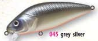
045 grey silver