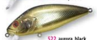
522 aurora black