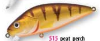
515 peat perch