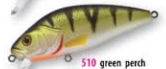
510 green perch