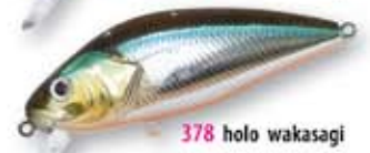
378 holo wakasagi