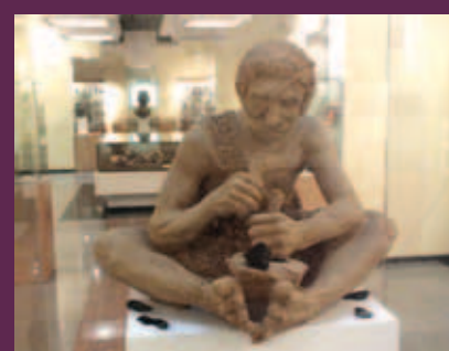
ТЕКСТ И ФОТО Валерий ПОСТНИКОВ

П РИМОРЬЕ БОГАТО СВОИМИ ДОРОГАМИ И ТРОПАМИ. НО ПУТЕШЕСТВОВАТЬ МОЖНО И НЕ СХОДЯ С МЕСТА. НУЖНО ПРОСТО ПЕРЕМЕСТИТЬСЯ ВО ВРЕМЕНИ, И ВЫ ПОПАДАЕТЕ В СОВЕРШЕННО НЕЗНАКОМУЮ СТРАНУ. ТАКИЕ ПРИКЛЮЧЕНИЯ МЫ ПРЕДЛАГАЕМ ВАМ СОВЕРШАТЬ, ОТПРАВЛЯЯСЬ НА ЖУРНАЛЬНЫЕ ЭКСКУРСИИ ПО ДРЕВНЕМУ ПРИМОРЬЮ.